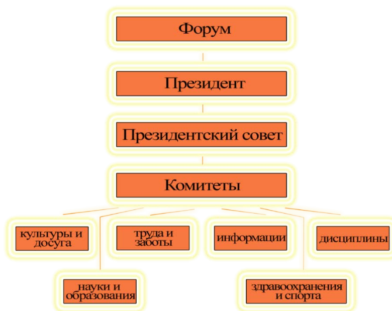
Схема самоуправления в городах