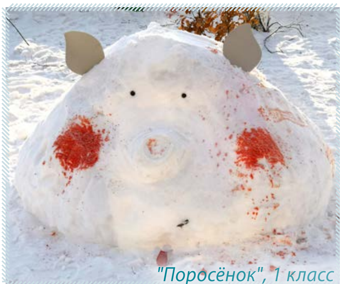
"Поросёнок", 1 класс