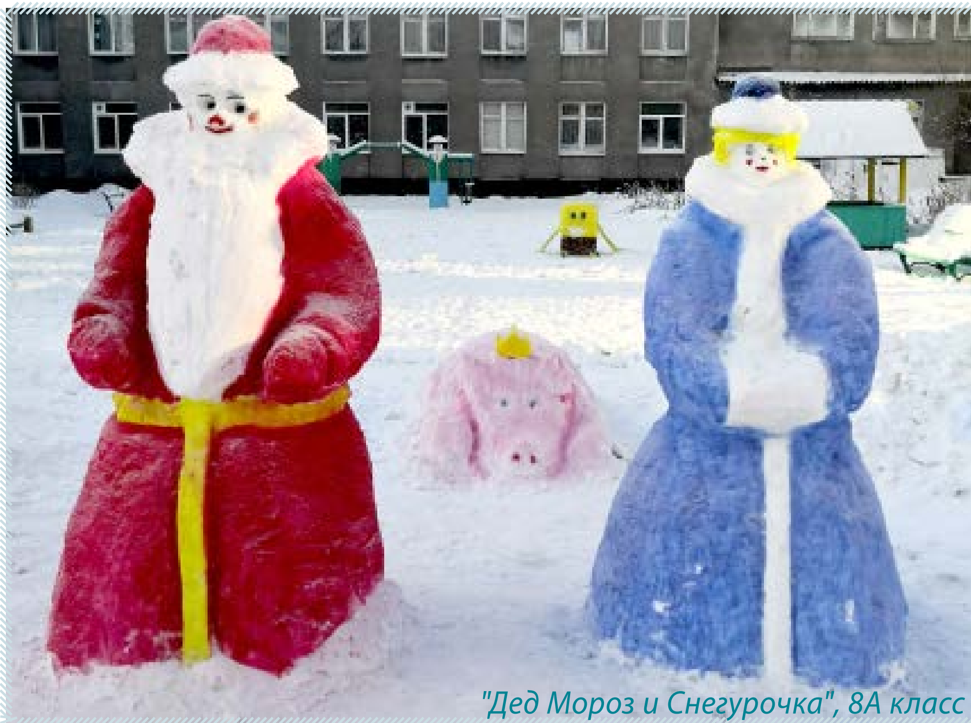
"Дед Мороз и Снегурочка", 8А класс