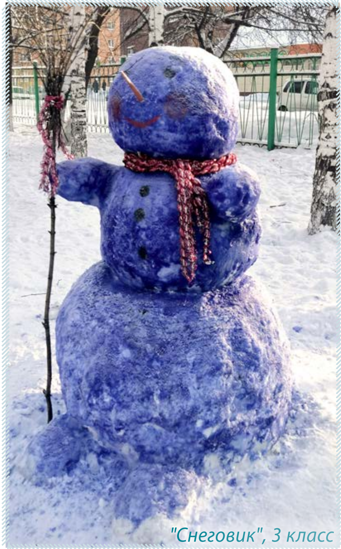
"Снеговик", 3 класс