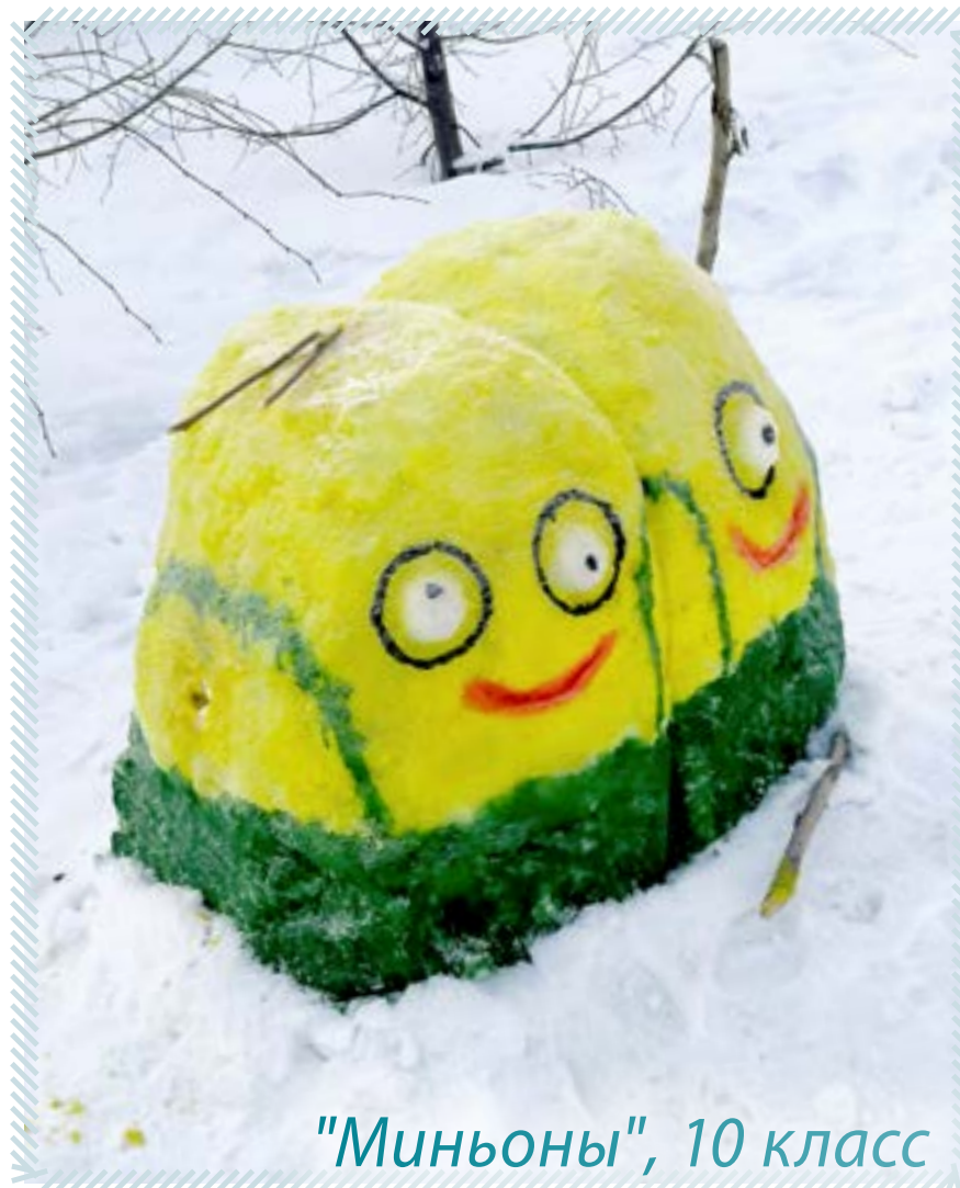
"Миньоны", 10 класс