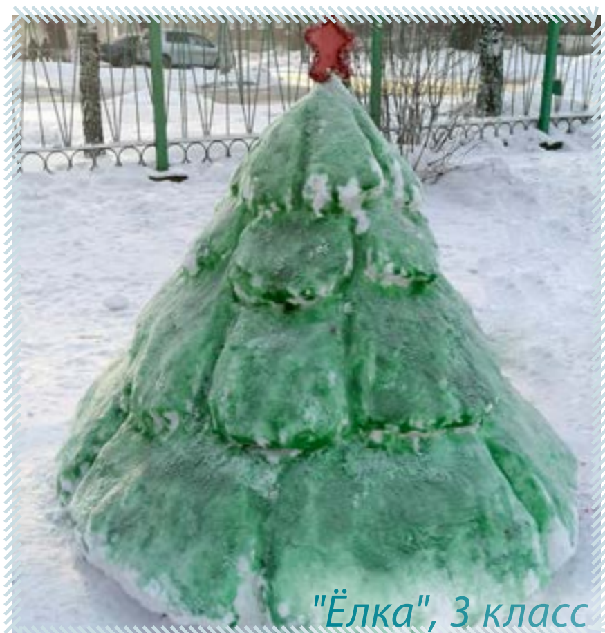
"Ёлка", 3 класс