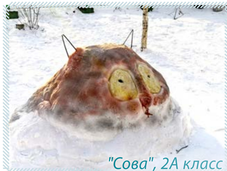
"Сова", 2А класс